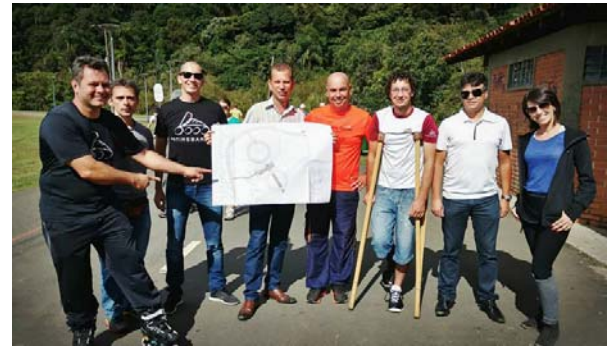
Apresentação do projeto da Secretaria do Meio Ambiente (SMMA) aos patinadores do Parque Barigui