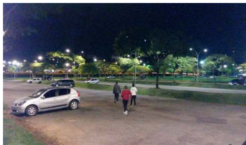
Iluminação no estacionamento do parque