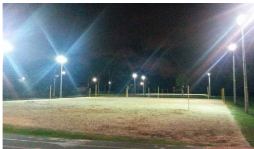
Iluminação nas quadras de areia